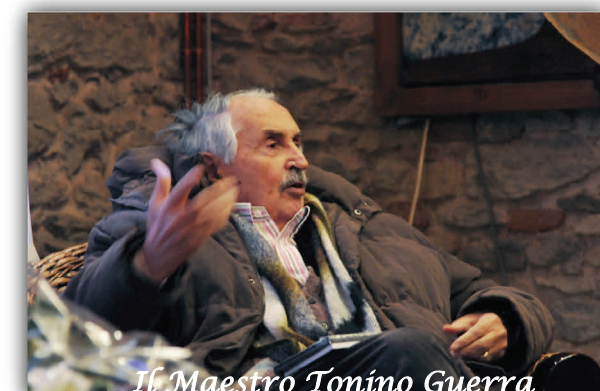
Il Maestro Tonino Guerra